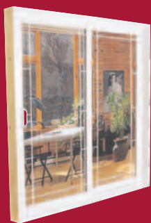
OPTION CARRELAGE CONTOUR