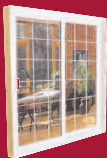
OPTION CARRELAGE GEORGIEN